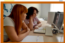
On-line консультация skype: centr-reab