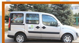
Социальное такси 48-31-77